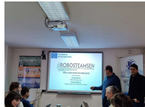
24/florenca/WhatsApp Image 2024-01-30 at 10.57.04.jpg)