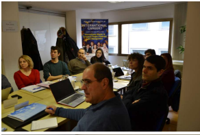
( https://www.cic.pt/atividades/2023-24/florenca/DSC_9510.jpg )