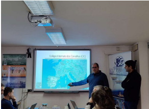
30 at 10.57.05.jpg)