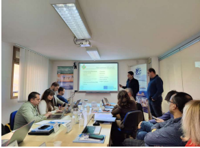
( https://www.cic.pt/atividades/2023-24/florenca/WhatsApp Image 2024-01-30 at 10.57.04 (1).jpg )